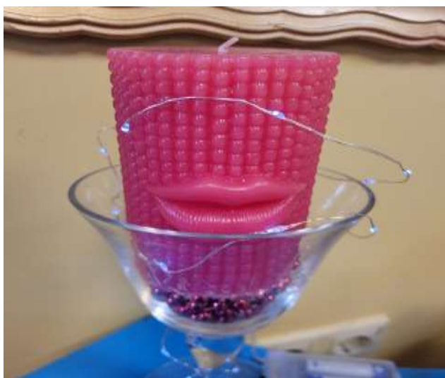
DALĪBA PROJEKTOS 1. LPP.