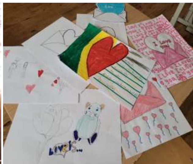
AKTUALITĀTES 17-20. LPP.