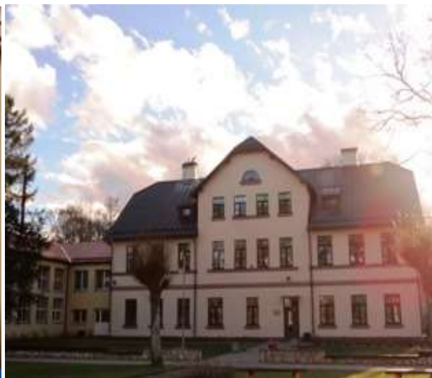
MĀCĪBU PROCESS 2.-16. LPP.