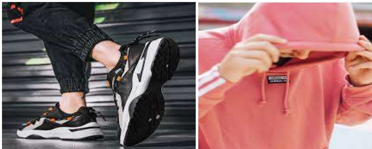
Jauniešu mode un stils

Garozas pamatskolā arī šogad, lai ienestu krāsas un pavasara vēsmas skolā, no 22.01. – 26.01., skolēni un skolotāji piedalījās skolēnu domes piedāvātajā aktivitātē “Krāsu un stila nedēļa”. Katrai dienai bija sava tēma – ‘Bārbijas un Keni”, “Neona diena”, “Baltā un melnā diena”, “Pasaku varoņu un slavenību diena”. Par aktīvu dalību klases saņēma saldu pārsteigumu no skolēnu domes. Šogad aktīvākie bija 1., 3. un 7.klases skolēni.